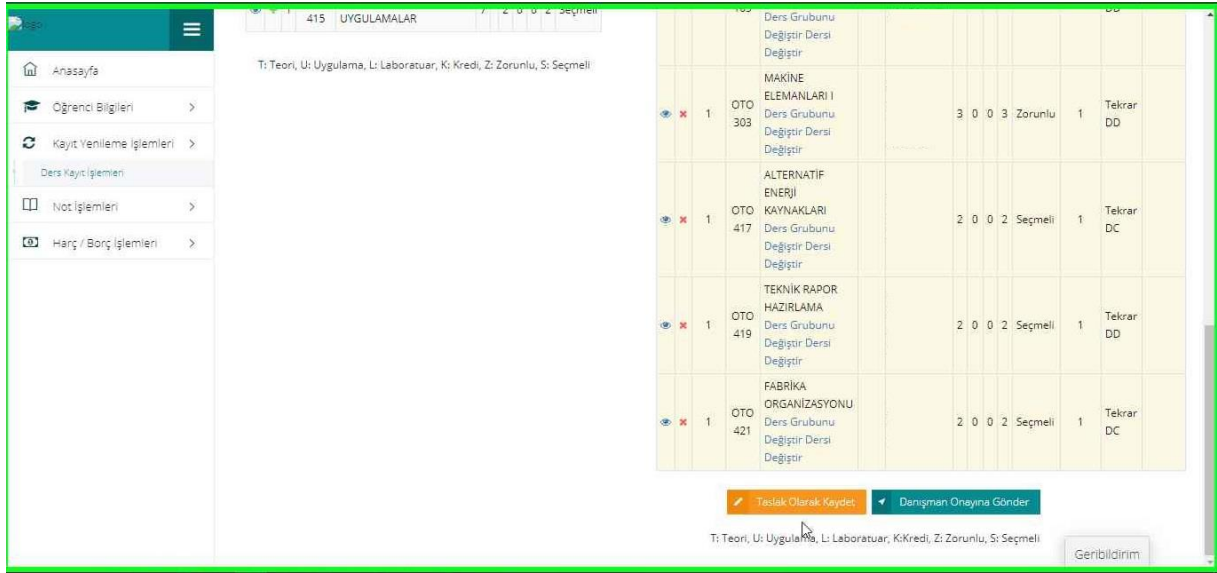
Resim-4: Kaydetme ekranı

4. Derslerinizi seçtikten ve Seçilen Dersleri ekledikten sonra “Seçilen Dersler” bölümüne geçerek derslerinizi son bir defa kontrol ederek aşağıda resimde gösterilen “Danışman Onayına Gönder” butonu vasıtasıyla derslerinizi danışmanınıza gönderebilirsiniz. Danışman onayına göndermeden önce “Taslak Olarak Kaydet” butonu ile seçimini yaptığınız dersleri kaydedebilir daha sonra tekrar düzenleyebilir ve seçilen dersleri kesinleştirdikten sonra danışman onayına gönderebilirsiniz.